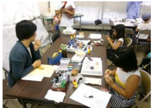
東京湾の「今」を考える(貝の工作)