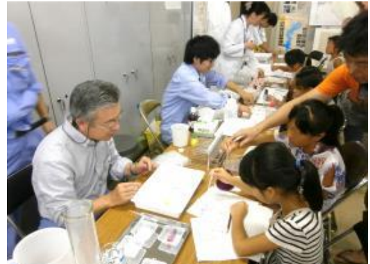
酸・アルカリってなあに？