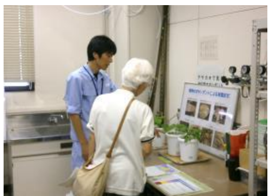
アサガオで知る光化学オキシダント