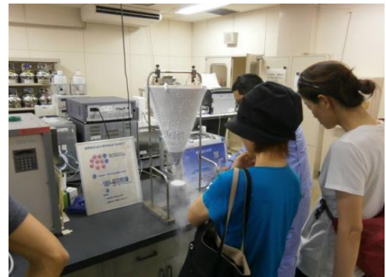
空気を使った化学実験