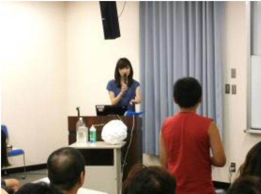
NHK気象キャスター井田寛子さんによる 講演「お天気のおはなし」