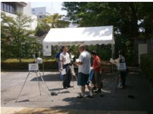
実感！サーモカメラで緑の効果を見てみよう