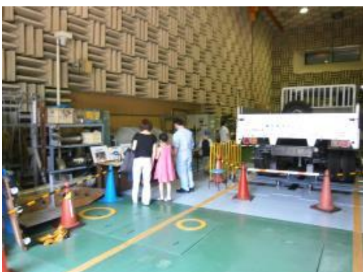
大型車シャシダイナモメータの公開