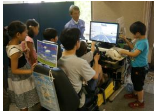
エコドライブにチャレンジ！