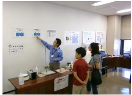
黒鉛に金属コーティングしてみよう！