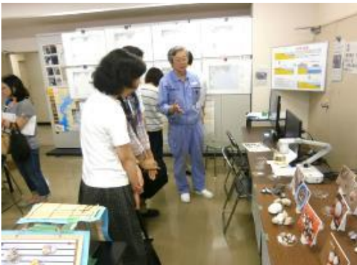
東京湾の「今」を考える