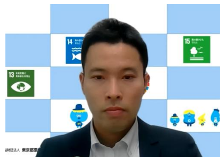
根本氏からの東京都の取組紹介