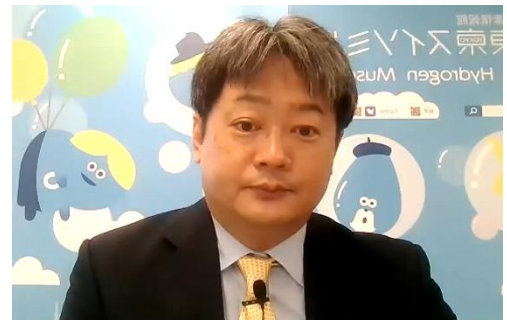
穴戸教授による基調講演