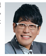
古坂大魔王 さん [故人、プロデューサー]

「進化する持続可能性とサステナブルな未来社会」 混迷する世界情勢の中で、古坂大魔王とスペシャリストがサステナブルな未来社会を解き明かします。次なるサステナビリティの歩みに挑む!