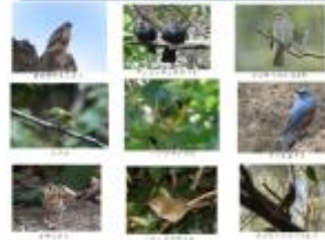
陸鳥9種(父島・母島で繁殖してる鳥)