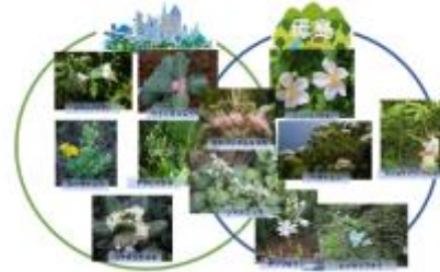
「進化の過程が見られる」とは…?