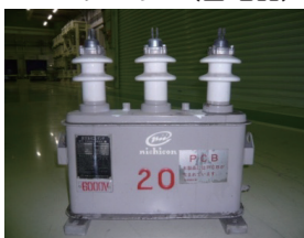
コンデンサー(蓄電器)

※1994年以降であっても、ユーザーによる絶縁油の入替え等によりPCB汚染されている可能性があるため、必要に応じて分析を行ってください。